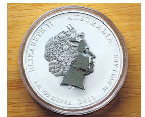
SØLVMYNT: Denne mynten fra Australia veier en kilo og har en verdi på omtrent 8000 kroner.