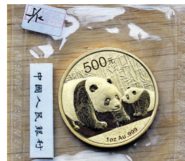
GULLBELAGT: Gullmyntene er pakket inn i plast for å forhindre riper i metallet. Denne mynten har en verdi på omtrent 9000 kroner.

– Jeg er overbevist om at myntene vil beholde sin verdi. Gull og sølv regnes som sikre investeringer og mange ser på det som en form for forsikring i perioder med lav økonomisk vekst, sier Westermark.